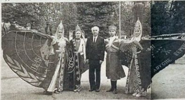
Стіашу Юрэ илшлагэхэр кылыгэлыгыгэхэрэм ежк адыфату ит.

— Зогорэ сипшлэшхэм «па... мы адыгэ клэлэхэр зэрэгэпсыгыгэр...» ало зыкыу э, «ялажыкэ» есло. Илэсэ 150-рэ зауи, икультурэ Ізклагэзи, нымкэ културэу хэцэгэ лэпкыу бгэунтлэу хэи рымышлоу кынагытэ сыда кысэкиштыр. Сэ елорэн урыс кул-турэм дэгыгытэ хэтымыкыгэу, ау тэ тимысу кыт-