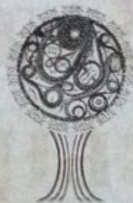
ЧЕРЕЗ ДИЗАЙН К МИРУ В МИРЕ МИФОВ И РЕАЛЬНОСТИ

Артистхэм шуашэхэр адыгъэу уяпIы зыхьукIэ, сурэтышI-модельерым игушысысэхэр нахъ куоу къызэIухыгъэнхэм