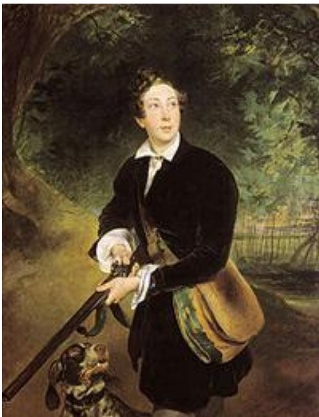
Портрет Алексея Толстого в юности, художник - К.П.Брюллов.

Будущий писатель родился в семье графа Константина Петровича Толстого, банковского советника и Анны Алексеевны урождённой Перовской, побочной дочери графа Алексея Кирилловича Разумовского. Отец добился для неё и братьев дворянского титула и фамилии «Перовские», а также дал основательное образование.